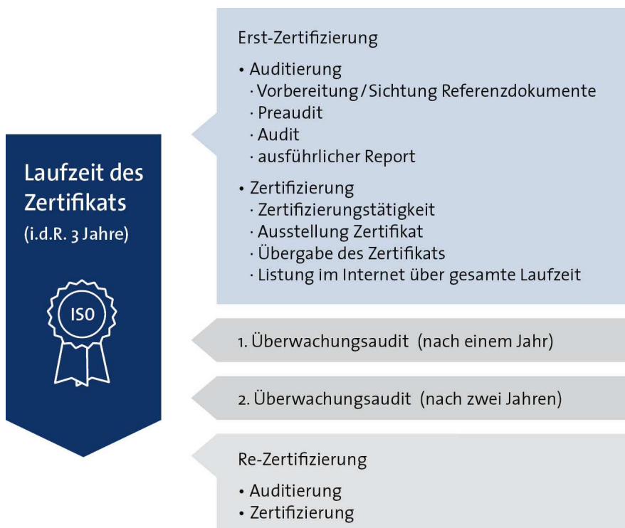
Abbildung 2: Lebenszyklus eines Zertifikats

Nachfolgend ist in Abbildung 2 der Lebenszyklus eines Zertifikates dargestellt.